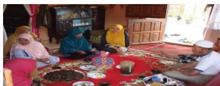
Aktivitas tradisi minum daun kawo sebagai penguat hubungan kekerabatan Masyarakat desa Ujung Pasir.