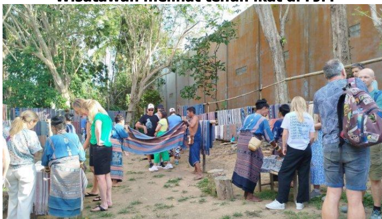
Gambar 2 Wisatawan melihat tenun ikat di FJM

Namun peneliti melihat bahwa meskipun Festival Jelajah Maumere (FJM) telah memberikan kontribusi yang signifikan dalam mempromosikan tenun ikat Sikka sebagai warisan budaya lokal, beberapa hambatan tetap muncul dalam proses promosi ini. Tantangan-tantangan ini perlu diatasi untuk memastikan keberhasilan promosi dan pelestarian tenun ikat secara berkelanjutan. Meskipun media sosial dan platform digital seperti Instagram dan Facebook telah digunakan untuk promosi, tidak