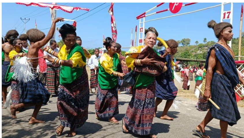
Gambar 3 Tarian tradisional dalam balutan tenun ikat di FJM

ke pasar global. Salah satu cara utama yang digunakan adalah dengan menyelenggarakan pameran budaya yang menampilkan berbagai jenis produk tenun ikat, baik dalam bentuk kain tradisional maupun produk-produk turunan seperti tas, selendang, dan aksesoris. Setiap daerah di Kabupaten Sikka, seperti Desa Nita, Paga, dan Wolowiro, memiliki ciri khas motif tenun yang mencerminkan karakteristik sosial dan budaya masing-masing. Festival ini memberikan ruang bagi pengunjung untuk mengapresiasi keindahan motif dan teknik tenun yang digunakan oleh pengrajin lokal. Dengan mengangkat tenun ikat Sikka sebagai salah satu daya tarik wisata, festival ini mampu menarik wisatawan untuk mengunjungi Sikka, tidak hanya untuk menikmati keindahan alam, tetapi juga untuk merasakan kekayaan budaya yang ada.