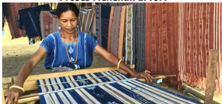
Gambar 1 Proses Menenun di FJM

Festival Jelajah Maumere juga berkolaborasi dengan komunitas lokal untuk mengedukasi generasi muda tentang pentingnya melestarikan tradisi menenun ikat. Melalui kunjungan ke festival dan partisipasi dalam kegiatan edukasi seperti workshop, anak-anak sekolah dapat belajar tentang kerajinan tradisional dan menyadari pentingnya menjaga budaya lokal agar tidak punah. Ini merupakan langkah penting untuk memastikan keberlanjutan tradisi tenun ikat di masa depan.