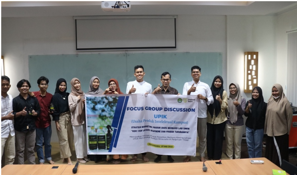
Gambar 1. Forum Group Discussion (FGD) Strategi Marketing Produk Baru Berbasis Lab/UMKM Graphene dan Produk Turunannya

Dalam FGD telah diperoleh masukan yang berharga berupa identifikasi strategi yang paling efektif dan paling memungkinkan untuk segera dilakukan dalam meningkatkan penjualan. Strategi paling prospektif untuk dilakukan adalah penjualan langsung dan reseller, disamping pemasaran online yang telah berjalan saat ini. Penjualan langsung dapat dilakukan dengan mendatangi konsumen di event-event tertentu, sedangkan strategi reseller dengan merekrut personal marketer melalui jaringan pertemanan maupun jaringan penjualan online. Tentu semua ini perlu dibekali dengan instrumen promosi baik berupa banner, brosur, flyer, video-video promosi, dan lain-lain.