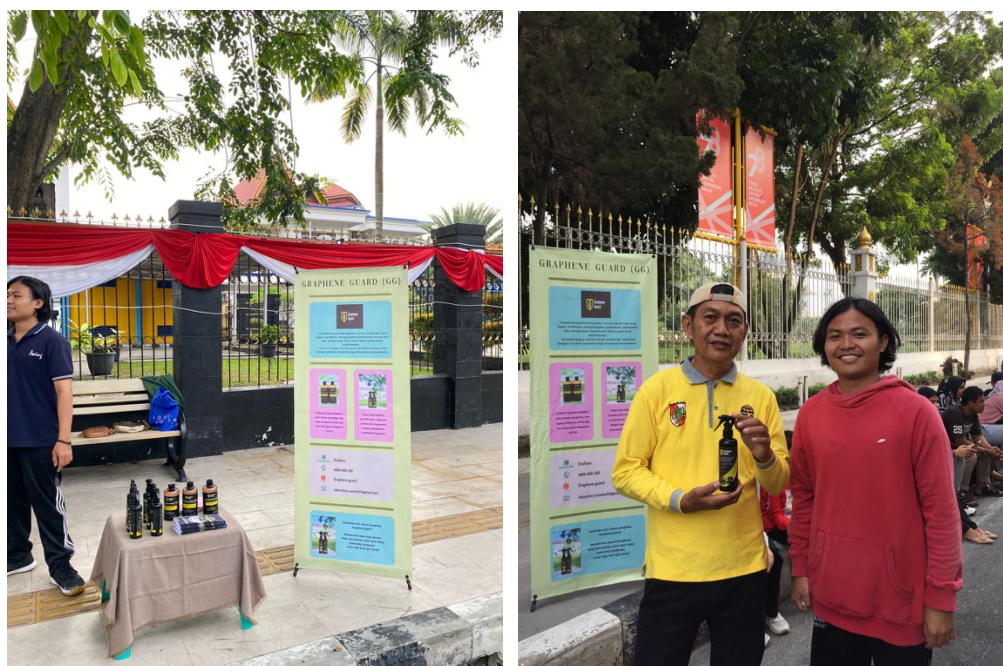
Gambar 3. Salah satu kegiatan penjualan langsung pada kegiatan car free day di Pekanbaru. Mahasiswa (penjual) berfoto bersama salah seorang pembeli (baju kuning)

Berbeda halnya dengan strategi penjualan online maupun offline, strategi penjualan reseller khususnya reseller offline justru menghasilkan penjualan yang meningkat cukup signifikan seperti terlihat pada Tabel 1. Dari Tabel 1 terlihat penjualan yang rendah pada rentang bulan Mei 2023 sampai Agustus 2023 karena strategi reseller ini belum dijalankan. Strategi reseller baru dijalankan pada bulan September 2023 setelah melihat penjualan secara online dan offline tidak menunjukkan hasil yang memuaskan. Strategi reseller dilakukan dengan mengumumkan dan meminta mahasiswa di Universitas Riau untuk menjual produk pengkilap GG dengan harga yang sangat miring, dan mereka bisa mengambail margin yang cukup besar. Harga pengkilap normal adalah Rp. 50.000,- /botol, sedangkan harga reseller hanya Rp. 37.500,-/botol, atau mereka mendapat margin Rp. 12.500,-/botol. Mahasiswa dibekali brosur, video produk dan testimoni, dan instrumen promosi lainnya. Strategi ini cukup jitu, dan mahasiswa juga sekaligus sebagai konsumen untuk merawat body kendaraan/motor mereka bila produk tidak laku terjual.