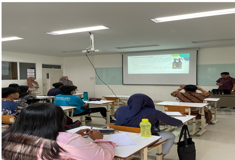
Gambar 4. Pengarahan Kepada Mahasiswa yang Tertarik Mengikuti Reseller Produk Pengkilap GG

Fenomena dimana penjualan produk secara online dan offline tidak meningkat meskipun telah melakukan intensifikasi iklan, sementara strategi pemasaran reseller justru mengalami peningkatan yang signifikan, mencerminkan perubahan dalam perilaku konsumen dan dinamika pasar yang semakin kompleks. Pertama, di era digital yang terus berkembang, konsumen menjadi lebih cerdas dan selektif dalam memilih produk ( Aulia & Aslami, 2023 ). Strategi pemasaran reseller, terutama jika dilakukan oleh individu atau kelompok kecil, sering kali memberikan nuansa personalisasi dan kepercayaan yang kuat. Pelanggan sering merasa lebih nyaman membeli dari orang atau kelompok yang mereka kenal, meskipun itu melalui reseller, karena mereka mendapatkan pengalaman yang lebih intim dan dukungan purnajual yang lebih baik.