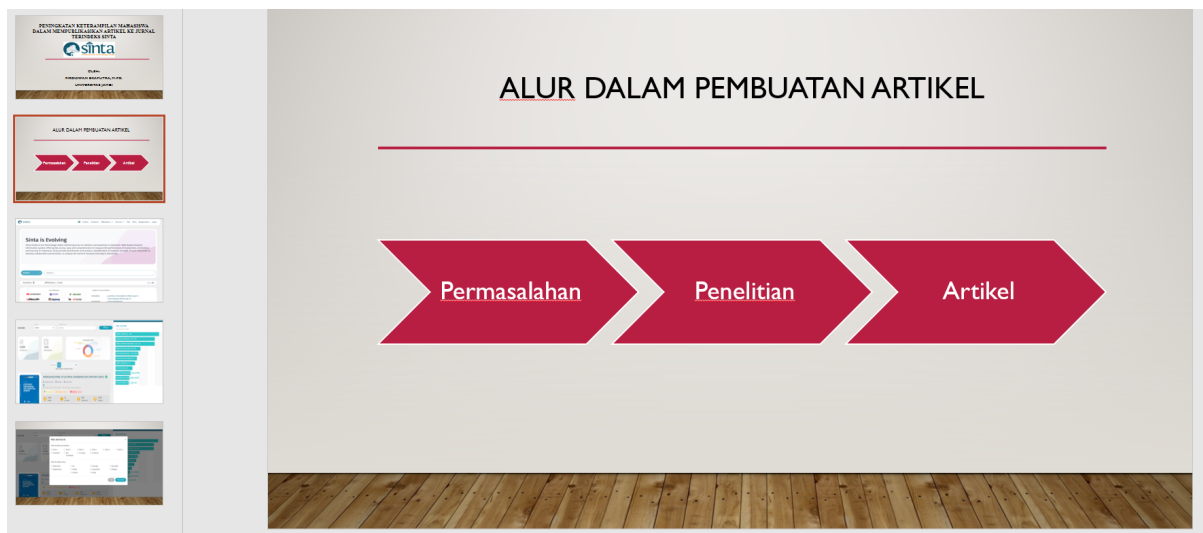
Gambar 2. Materi Pelatihan

Materi pelatihan meliputi cara membuka website sinta, mencari jurnal yang terakreditasi sinta, menentukan penggolongan jurnal yang terakreditasi sinta, dan cara mempublikasikan artikel pada jurnal terakreditasi sinta.