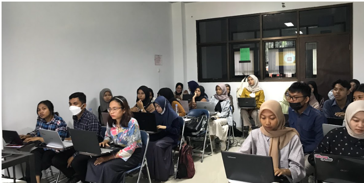
Gambar 3. Mahasiswa mencoba mengakses website sinta

yang terakreditasi sinta. Mahasiswa juga diminta untuk menentukan jurnal yang sesuai dengan artikel yang dikembangkan.