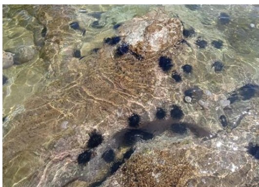
Gambar 3 Habitat ditemukan Echinothrix diadema dan Echinothrix calamaris

Diketahui bahwa bulu babi (Echinoidea) tidak hanya berhabitat dan juga persebarannya di kawasan terumbu karang, tetapi juga di daerah kawasan lamun. Persebaran bulu babi (Echinoidea) tergantung terhadap perkembangan faktor substrat dan juga faktor ketersediaan makanan (Arhas et al., 2015).