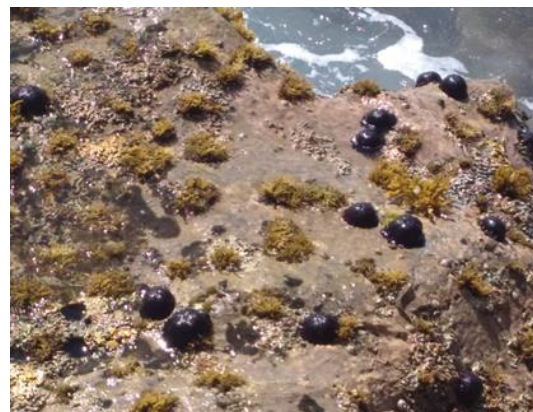
Gambar 4 Habitat ditemukan Colobocentrotus atratus

Berdasarkan hasil temuan penelitian karakteristik habitat Echinodermata yang ditemukan yaitu stasiun 1 didominasi batuan karang dan paparan terumbu karang. Pada penelitian ini di temukan dengan kedalaman maksimum 2 meter. Sedangkan stasiun 2 didominasi substrat pasir dan tidak ada paparan terumbu karang. Kedalaman maksimum 2,5 meter. Diperkuat hasil temuan (Hartati et al., 2018) bahwa substrat dasar terdiri dan pasir, terumbu karang dan pecahan karang yang merupakan habitat bagi hewan jenis Asteroidea dan Echinoidea.