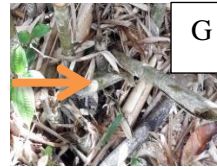
Gambar 1. Type phytotelmata yang ditemukan dari tanaman (a) Crynum asiaticum , (b) Musa sp., (c) Colocasia gigantea , (d) Nepenthes mirabilis , (e) Cyathea coopei , (f) Areca catechu , (g) Bambusa sp.