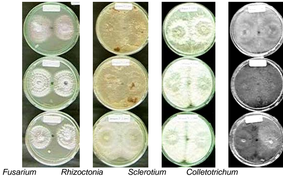
Gambar 2. Salah satu hasil pengujian aktivitas anti cendawan, pelarut kloroform terhadap beberapa cendawan patogen tanaman (5 hari inkubasi)

sebagai fungisida hayati karena mempunyai aktivitas yang kuat dalam menghambat pertumbuhan cendawan. Hasil uji aktivitas untuk 5 hari inkubasi menunjukkan Torosflavon D 3 ppm sudah dapat menghambat pertumbuhan koloni Fusarium oxysporum fsp. lycopersici . Sedangkan terhadap cendawan uji lain, Torosflavon D tidak menghambat pertumbuhan. Senyawa Torosflavon D 5 ppm paling efektif persentase penghambatan menghambat pertumbuhannya terhadap jari-jari koloni cendawan Fusarium oxysporum fsp. lycopersici (=48,75%), salah satu hasil uji aktivitasnya dapat dilihat pada Gambar 3 berikut :