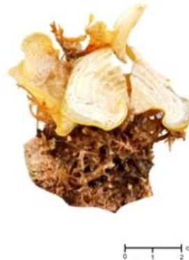
Gambar 1. Makroalga spesies Padina Australis ;

batu karang mati, Hal ini sejalan dengan apa yang ditemukan oleh Yusriana et al., (2020) bahwa makroalga jenis P. australis tumbuh menempel di batu pada daerah terumbu. Alat perekat yang digunakan oleh P. australis berupa cakram pipih, dan biasanya terdiri dari cuping pipih. Thallusnya berbentuk kipas berupa segmen-segmen lembaran tipis, dan memiliki garis-garis serabut radial pada permukaan daun. P. australis memiliki warna cokelat-kekuningan. Namun, kadang-kadang juga berwarna putih. Hal ini dikarenakan oleh proses perkapuran di permukaan daun. P. australis mempunyai tubuh yang terdiri dari hold-fast (seperti akar), stipe (seperti batang), blade (seperti daun) (Nurrahman et al., 2020).