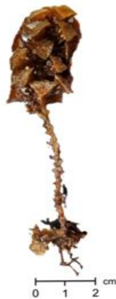
Gambar 2. Makroalgae spesies Turbenaria decurrens