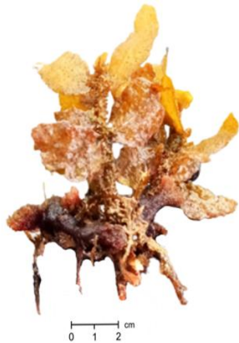
Gambar 2. Makroalga coklat spesies Sargassum polycystum

Sargassum polycystum tumbuh pada zona pasang surut karena tumbuhan ini membutuhkan cahaya untuk berfotosintesis dan menempel pada substrat keras seperti karan berpasir. Makroalga S. polycystum memiliki thallus berbentuk daun lonjong, tepi daun bergerigi. Warna dari makroalga S. polycystum didominasi oleh warna coklat dengan bentuk talus berbentuk silindris. Menurut Meriam et al., (2016) thallus pada S. polycystum berwarna pirang gelap hingga pirang kekuningan.