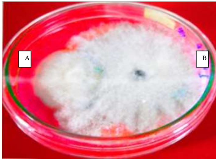
Gambar 1. Uji penghambatan langsung, cendawan endofit tidak mempunyai efek antibiosis. A ( C. acutatum ), dan B (cendawan endofit).