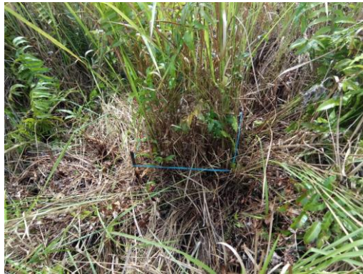
Gambar 2. Pengambilan sampel tumbuhan bawah pada plot persegi 0,5 x 0,5 m

Biomasa tumbuhan bawah diukur dengan cara destruktif melalui pemotongan semua bagian vegetasi di atas permukaan tanah dari plot berukuran 0,5 x 0,5 meter (Gambar 2). Tahapan pengukuran biomasa tumbuhan bawah dilakukan sebagai berikut (Wibowo et al, 2013): kuadran kayu ditempatkan sebagai plot; semua tumbuhan bawah (pakis dan ilalang) yang terdapat di dalam kuadran dipotong kemudian dimasukkan ke dalam kantong kertas dan diberi label sesuai dengan kode titik pengambilan; ditimbang berat basah dan dicatat beratnya dalam tally sheet ; biomasa tanaman dikeringkan dan dioven pada suhu 80 °C selama 2 x 24 jam atau sampai berat konstan; berat keringnya ditimbang dan catat dalam tally sheet . Kandungan karbon kira-kira 47%-50% dari biomassa dan dihitung dengan rumus C = \text{Biomasa} \times 0,47