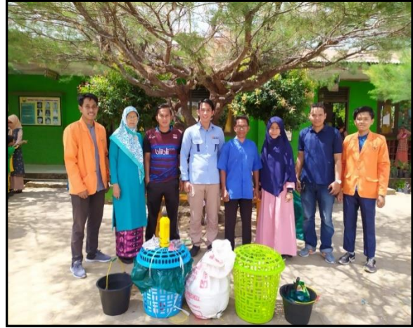
Gambar 5. Keranjang takakura setelah diisi sampah organik dan siap proses menjadi kompos

Langkah selanjutnya adalah monitoring dan evaluasi agar informasi tentang pengelolaan sampah dapat ditularkan ke internal sekolah. Dalam tahap ini, tim dan para siswa bersama-sama melakukan kegiatan diskusi dan tanya-jawab seputar teori yang telah diajarkan pada tahap persiapan dan kegiatan peragaan yang telah dilakukan pada tahap pelaksanaan. Tim melontarkan beberapa pertanyaan terkait materi kepada para siswa. Dalam proses diskusi dan tanya jawab, tim menyediakan hadiah kepada siswa yang berani bertanya dan atau yang bisa menjawab pertanyaan yang diberikan oleh tim. Hal ini dilakukan untuk memotivasi para siswa agar berani memberikan pendapat dan menjawab pertanyaan. Dari hasil diskusi dapat disimpulkan bahwa kesadaran para siswa akan pengolahan sampah organik yang ada