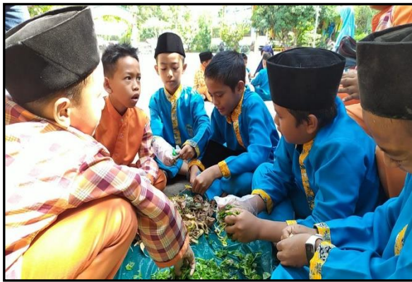
Gambar 3. Siswa ikut mencacah sampah organik menjadi ukuran kecil

masing-masing tim selesai membuat keranjang takakura, para siswa mencari sampah organik yang ada di lingkungan sekolah. Mereka mencari sampah organik dengan bekal pengetahuan materi tentang sampah organik yang telah diberikan oleh tim pada saat tahap persiapan. Setelah sampah organik terkumpul, para siswa memasukkan sampah tersebut kedalam keranjang takakura.