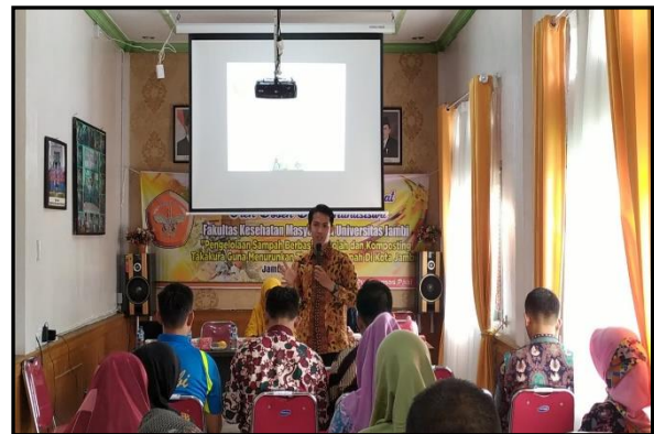
Gambar 2. Sosialisasi materi

Kegiatan ini dimulai dengan tahap persiapan melalui koordinasi antar pihak yang terkait yaitu Tim Pengabmas, Penanggungjawab UKS dan Kesehatan Lingkungan Puskesmas, serta Guru UKS dari masing-masing sekolah dasar. Kemudian sosialisasi materi pengelolaan sampah organik berbasis sekolah dengan menggunakan metode keranjang Takakura.