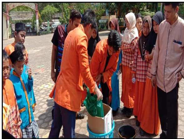
Gambar 4. Mempraktikkan setiap tahapan composting dengan keranjang takakura