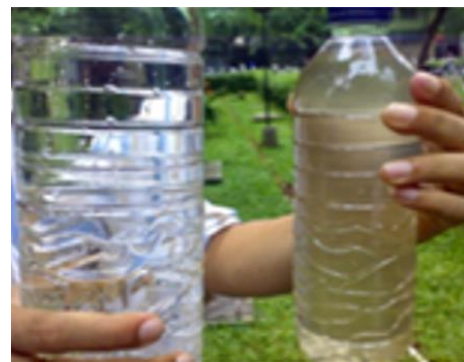
Gambar 3. Perbandingan air sebelum dan setelah proses penjernihan air Rapid Sand Filter

Pertemuan tim pelaksana PPM dengan mitra, yakni ketua RT 51 Kelurahan Lingkar Selatan, dilakukan guna membahas rencana kegiatan pengabdian yang akan dilakukan di RT 51 Kelurahan Lingkar Selatan, seperti penyuluhan dan pembuatan alat penjernih air