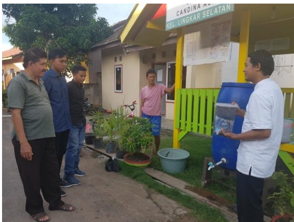
Gambar 8. Sosialisasi cara pemeliharaan alat penjernih air Rapid Sand Filter