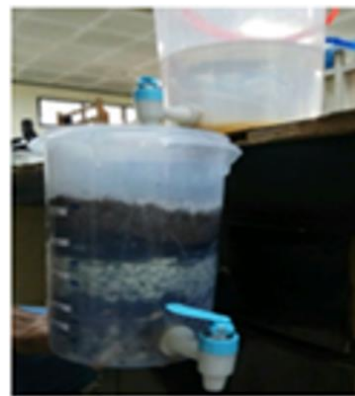
Gambar 2. Proses penjernihan air Rapid Sand Filter

Kedua bak tersebut kemudian digunakan untuk penjernihan air, dimana bak pengendapan diposisikan berada di atas bak penyaringan (Gambar 2). Air yang telah dijernihkan dengan metode ini kemudian dibandingkan dengan air awal untuk melihat perbedaannya secara visual (Gambar 3).