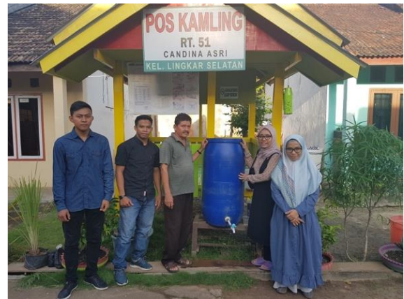
Gambar 6. Pemberian alat penjernih air Rapid Sand Filter

Kegiatan penyuluhan ini juga dimanfaatkan tim PPM untuk menyampaikan cara menggunakan (Gambar 7) dan memelihara (Gambar 8) alat penjernih air Rapid Sand Filter yang baik. Cara penggunaan alat penjernih air Rapid Sand Filter , yaitu: