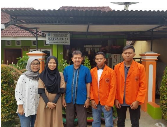
Gambar 4. Pertemuan tim PPM dengan Ketua RT 51 Kelurahan Lingkar Selatan

dengan menggunakan metode Rapid Sand Filter (Gambar 4).