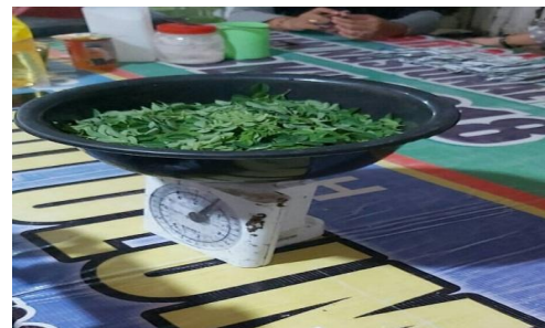
Gambar 2. Proses penggilingan daun kelor

Proses pembuatan stik kelor, siapkan daun kelor yang segar kemudian dicuci bersih dengan air putih setelah itu daun kelor dimasukkan ke dalam penggilingan sedikit dikasih air putih untuk memudahkan dalam menghaluskan daun kelor setelah daun kelor halus di ambil dan dituang ke wadah untuk dicampurkan dengan komposisi lainnya.