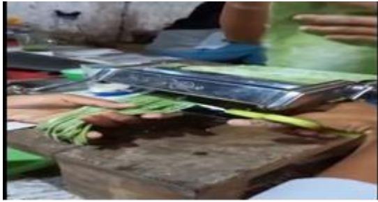
Gambar 3. Proses pembuatan stik kelor

Pada saat tim melakukan pelatihan pembuatan stik kelor disampaikan juga tentang alat-alat dan bahan-bahan yang dibutuhkan dalam proses pembuatan stik kelor, dan beberapa prosedur ataupun tahapan-tahapan dalam pembuatan stik kelor.