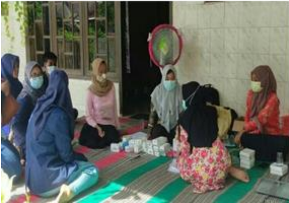
Gambar 6: Pelatihan pemasaran dan tanya jawab