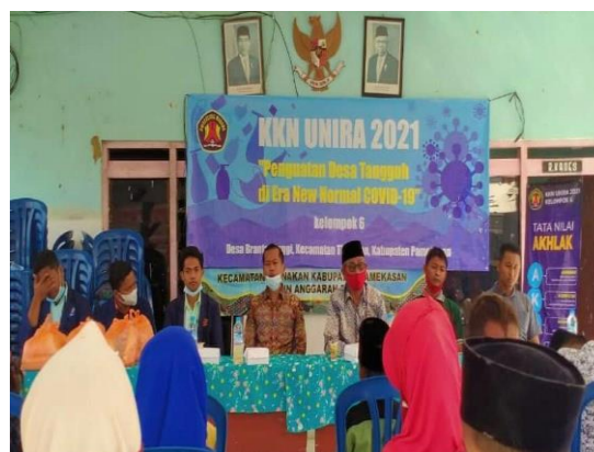
pengemasan dan pemasaran