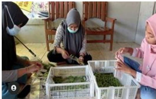
Gambar 5. Proses pengemasan produk stik kelor

Pada saat tim melakukan pelatihan pembuatan stik kelor disampaikan juga tentang alat-alat dan bahan-bahan yang dibutuhkan dalam proses pembuatan stik kelor, dan beberapa prosedur ataupun tahapan-tahapan dalam pembuatan stik kelor.