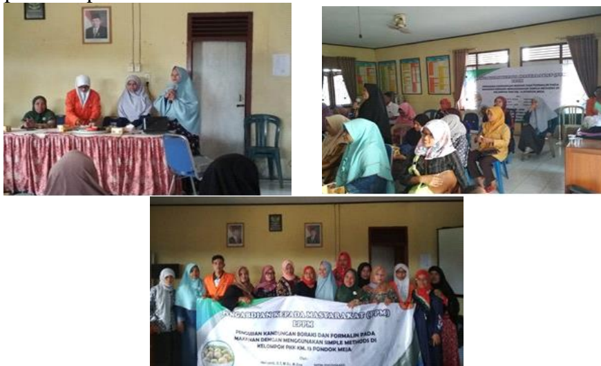
Gambar 2. Sosialisasi ke Ibu-Ibu PKK Desa Pondok Meja

Kegiatan penyuluhan dan pengujian boraks dan formalin pada makanan dilakukan di Gedung Pertemuan Pemerintah Desa Pondok Meja, Kecamatan Mestong, Kabupaten Dusun Purwodadi Muaro Jambi dan Desa Pondok Meja. Kegiatan diawali dengan penyuluhan tentang bahaya penggunaan boraks dan formalin pada makanan, ciri-ciri makanan yang mengandung boraks dan formalin, dan cara pengujian terhadap beberapa bahan makanan yang mengandung boraks dan formalin menggunakan simple method. Ibu-ibu PKK sangat antusias dan aktif dalam mengikuti kegiatan ini. Hal ini terlihat dari banyaknya pertanyaan yang disampaikan pada tim pelaksana.