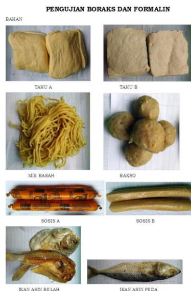
Gambar 3. Bahan-bahan Uji