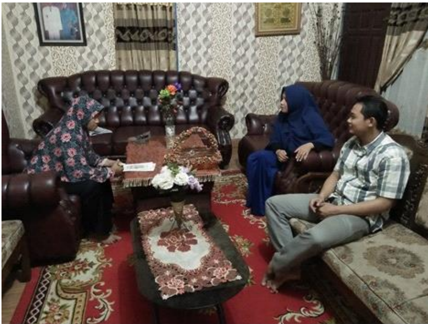
Gambar 1. Pertemuan TIM pengabdian dengan Mitra

Kegiatan ini diawali dengan melakukan koordinasi dengan pihak desa dilakukan dengan Ibu Kepala Desa Pondok Meja tentang kegiatan PPM dengan judul “Pengujian Kandungan Boraks Dan Formalin Pada Makanan Dengan Menggunakan Simple Methods Di Kelompok PKK Km. 13 Pondok Meja”. Pertemuan ini dilakukan guna membahas rencana kegiatan pengabdian yang akan dilakukan seperti penyuluhan tentang bahaya penggunaan boraks dan formalin pada makanan, ciri-ciri makanan yang mengandung boraks dan formalin, dan melakukan pengujian terhadap beberapa bahan makanan yang mengandung boraks dan formalin menggunakan metoda yang sederhana. Hasil koordinasi dengan Ibu Kepala Desa Pondok Meja adalah mereka menyambut baik dan bersedia menjadi mitra dalam pelaksanaan kegiatan PPM ini.