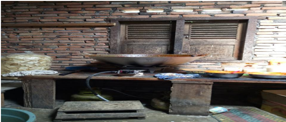
Gambar 1. Dapur Produksi Keripik Singkong Rasa Pedas

Setelah pemaparan materi, peserta yang hadir turut berpartisipasi aktif dalam sesi tanya jawab.