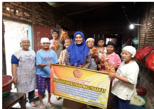
Gambar 2. Berpose Selesai Kegiatan Pengabdian