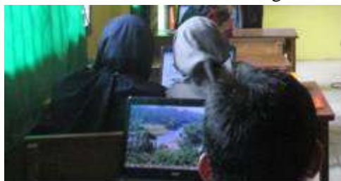
Gambar 2: Penginstalan Software SPSS

Selanjutnya penyampaian pengenalan Software SPSS bersama dengan Penggunaan Toolbar serta analisis Data Deskriptif. Gambaran Materi yang diberikan adalah sebagai berikut: