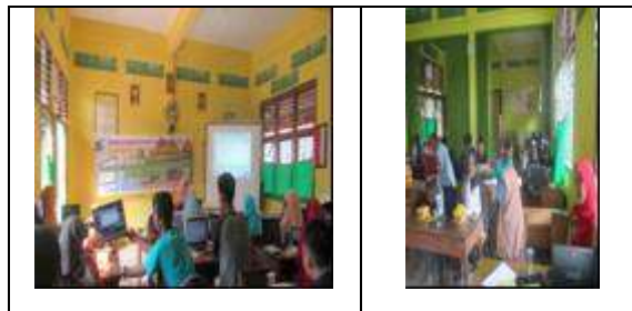
Gambar 4: Antusias Peserta

Setelah selesai menyampaikan uraian tiap bagian, pemateri meminta peserta mengerjakan yang ada pada modul. Beberapa dokumentasi yang diambil pada waktu pelatihan berlangsung diberikan sebagai berikut: