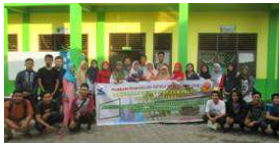
Gambar 5: Photo Bersama Antara Tim Pengabdian Masyarakat dan Peserta Pelatihan