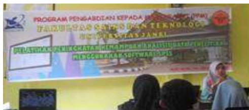
Gambar 1: Pembukaan oleh Ketua Tim Pengabdian Masyarakat

Kegiatan pertama yang dilakukan yaitu pembukaan oleh ketua PPM kemudian dilanjutkan dengan penginstalan program pada masing-masing peserta yang terlihat pada gambar 1 dan gambar 2.