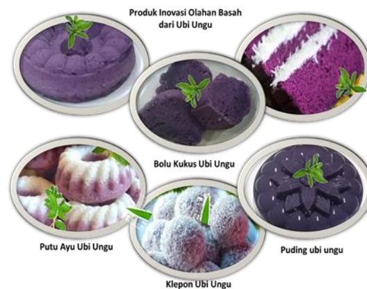
Gambar 3. Beberapa produk inovasi olahan basah dari ubi ungu