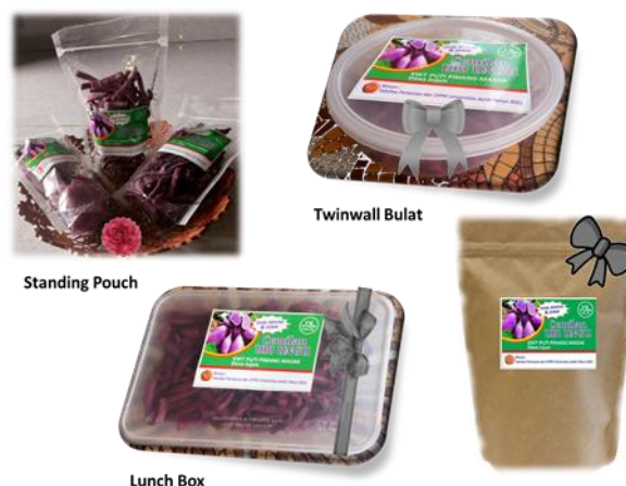
Gambar 4. Beberapa kemasan dan branding produk ubi ungu