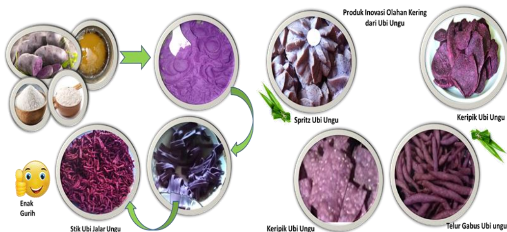
Gambar 2. Beberapa produk inovasi olahan kering dari ubi ungu

Ubi jalar ungu biasanya dijual oleh mitra wira desa dalam bentuk segar dengan harga yang murah. Penerapan inovasi produk olahan ubi jalar ungu organik dapat meningkatkan pengetahuan dan keterampilan mitra wira desa sehingga perekonomian mitra wira desa dapat meningkat. Inovasi produk olahan ubi jalar ungu organik yang telah diterapkan seperti olahan kering yakni stik ubi jalar ungu, spritz ubi ungu, keripik ubi ungu, dan telur gabus ubi ungu serta olahan basah yakni bolu kukus ubi ungu, putu ayu ubi ungu, klepon ubi ungu dan puding ubi ungu. Produk ini berpeluang besar untuk dikembangkan di Desa Jujun sebagai produk usaha karena bahan baku (ubi jalar ungu) banyak terdapat di Desa Jujun. Selain itu Desa Jujun merupakan Ibukota Kecamatan Keliling Danau yang mempunyai pusat pasar bagi desa-desa di sekitarnya. Peluang lain pengembangan produk olahan ini cukup besar untuk di pasarkan ke pusat Kota Sungai Penuh yang jaraknya sekitar 24 km. Pusat Kota Sungai Penuh ini sudah banyak terdapat swalayan dan toko – toko makanan.