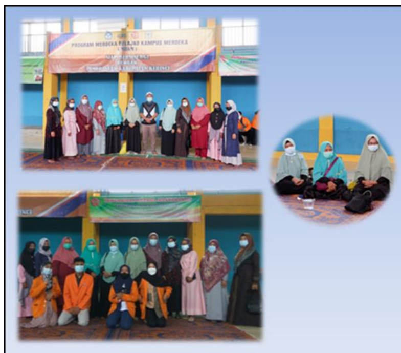
Gambar 6. Kunjungan Wakil Rektor 4 UNJA