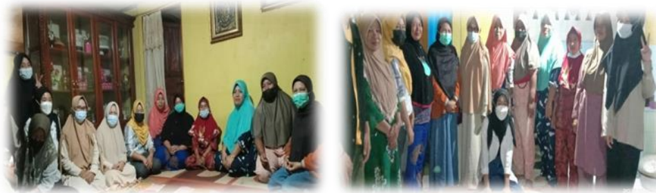
Gambar 5. Mitra UMKM saat pelatihan

Kegiatan ini menjelaskan tentang SDM sebagai persiapan bisnis yang akan berkembang di masa akan datang. Pelatihan yang dilakukan adalah untuk menjadikan SDM searah meningkatkan tujuan kelompok usaha. Kegiatan dirancang untuk meningkatkan keahlian, pengetahuan, pengalaman ataupun perubahan sikap SDM. Seorang wirausaha selalu mendapatkan dukungan kesiapan SDM dalam menjalankan usahanya dan mampu menghadapi perubahan usaha yang ada. Kegiatan ini bermanfaat dalam menentukan efektivitas dan efisiensi usaha.