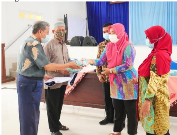
Gambar 5. Pembagian masker dan media edukasi pencegahan Covid-19