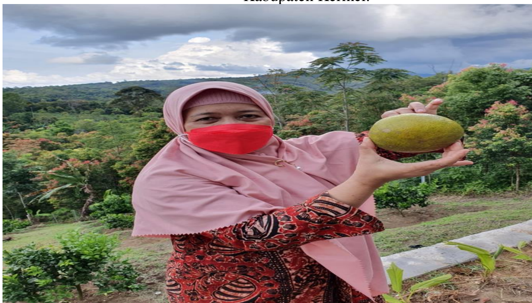
Gambar 2. Potensi Ekowisata Desa Pasar Kerman / Lolo Gedang Kecamatan Bukit Kerman Kabupaten Kerinci.

Disamping agro wisata di Desa Pasar Kerman / Lolo Gedang Kabupaten Kerinci, maka dapat pula di kembangkan ekowisata, dengan dukungan alam yang indah jika dikelola secara berkelanjutan menciptakan wisata berbasis alam. Strategi kawasan ekowisata Desa Pasar Kerman / Lolo Gedang berdasarkan observasi dapat dijadikan asset daerah dengan menjadikan potensi alam sebagai investasi. Pemanfaatan lahan sebagai agrowisata jeruk dapat pula dijadikan potensi ekowisata untuk mendukung konservasi lahan secara berkelanjutan.