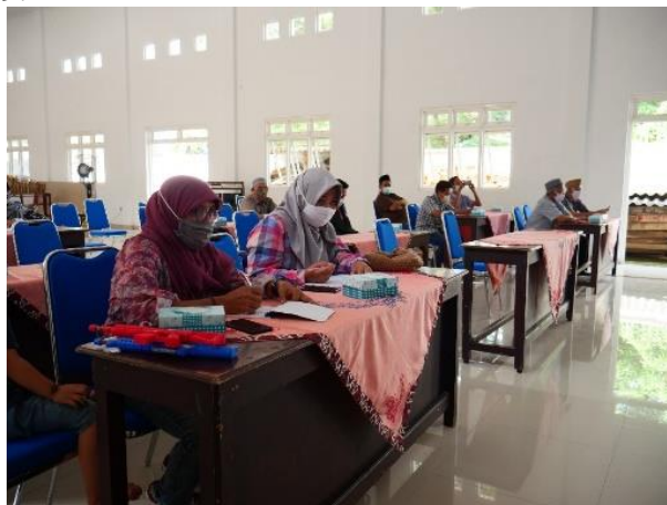
Gambar 3. Sosialisasi dan edukasi mengenai PHBS