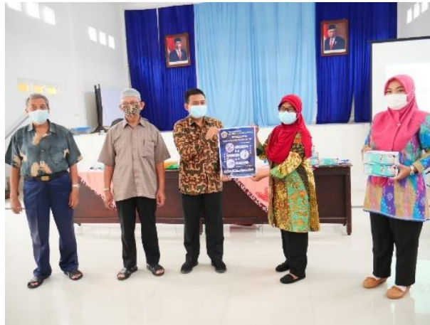
Gambar 6. Simulasi pencegahan Covid-19