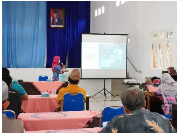
Gambar 2. Sosialisasi dan edukasi mengenai protokol kesehatan dalam pencegahan Covid-19