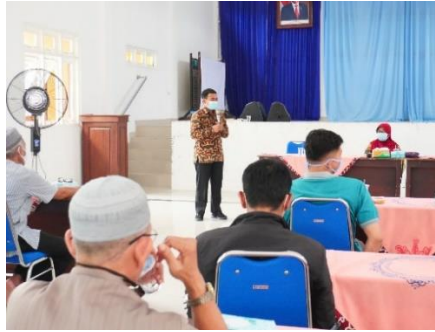
Gambar 4. Sosialisasi dan edukasi mengenai Peraturan Bupati Kudus Nomor 41 Tahun 2020