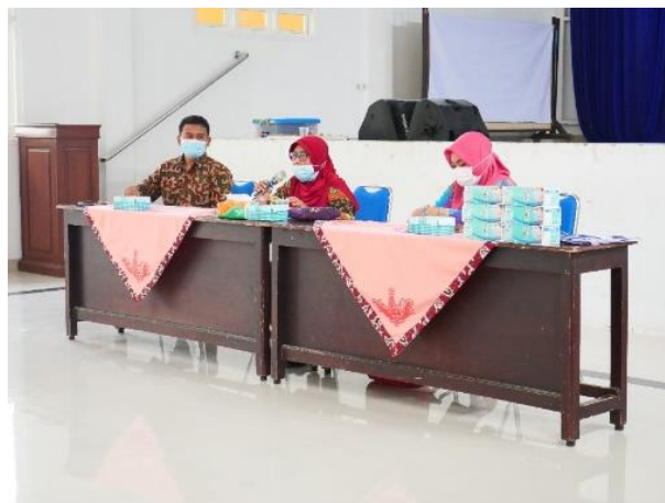
Gambar 7. Evaluasi oleh masyarakat

Kegiatan evaluasi ini dilakukan oleh masyarakat (diwakili oleh kepala Desa Gondosari) dan tim pengabdian berupa kegiatan saling menilai, memberi kritik, saran, masukan, dan penghargaan atas hasil penerapan protokol kesehatan, pemasangan media poster dan spanduk.