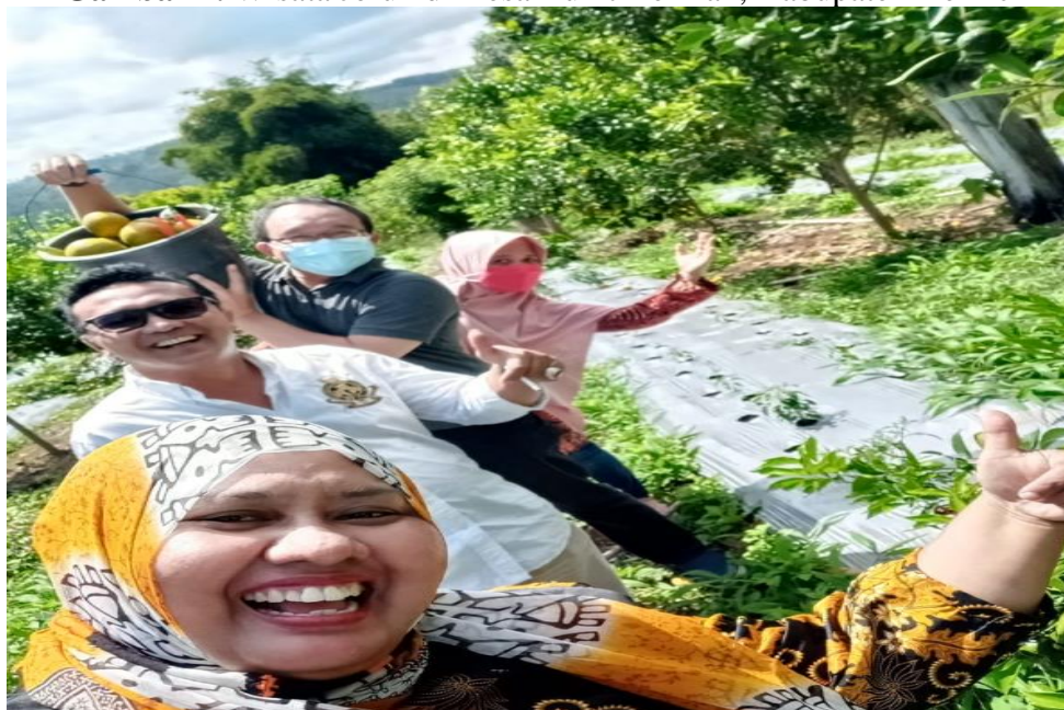
Gambar 1. Wisata Jeruk di Desa Bukit Kerman, Kabupaten Kerinci

Kabupaten Kerinci ditentukan sebagai branding wisata di Provinsi Jambi. Sebagai branding wisata maka potensi yang dimiliki Kabupaten Kerinci sebagai destinasi atau desa wisata harus memiliki identitas dan karakteristik yang unik, seperti yang dimiliki oleh salah satu desa di Kabupaten Kerinci yaitu Desa Pasar Kerman / Desa Lolo Gedang yang memiliki potensi yang cukup besar sebagai desa wisata. Panorama alam yang indah, hasil perkebunan jeruk yang berlimpah menjadi identitas sebagai branding wisata Desa Pasar Kerman / Desa Lolo Gedang Kabupaten Kerinci. Para wisatawan yang berkunjung ke Kabupaten Kerinci akan menuju Desa Pasar Kerman / Desa Lolo Gedang sebagai penghasil perkebunan jeruk terbesar di kabupaten Kerinci, dan menjadikannya sebagai kunjungan wisata yang tidak boleh dilewatkan.