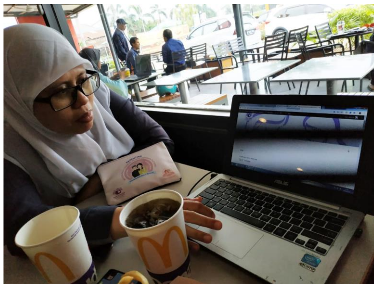
Gambar 2. pengurus komunitas sedang mempraktikkan teori yang disampaikan

Pada Gambar 2 pengurus komunitas Exclusive Pumping Mama Indonesia sedang mempraktikkan teori yang diberikan instruktur dan didampingi oleh asisten.