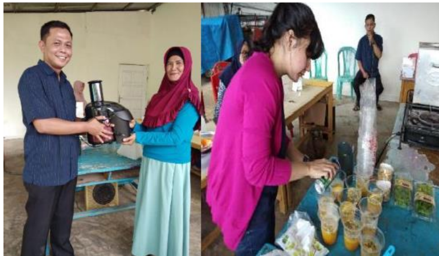
Gambar 2. Foto Kegiatan Pengabdian Kepada Masyarakat

Saat ini menurut Lurah Kenali Asam Atas telah berdiri koperasi yang beranggotakan warga sekitar. Dari koperasi ini diharapkan masyarakat mampu secara bersama-sama meningkatkan pemberdayaan ekonomi di wilayah mereka. Dana koperasi diperoleh dari iuran wajib dan iuran bulanan dari para anggota. Masyarakat telah memiliki dua Kelompok Usaha Bersama (Kube) yang memproduksi industri olahan makan ringan yang mereka jual ke beberapa Toko Modern disekitar Kota Jambi. Untuk saat ini olahan produk dari buah markisa yaitu sirup masih diproduksi berdasarkan pesanan dari para konsumen. Diharapkan kedepannya melalui Kube ini dan peran penting dari Aparat Pemerintah Kota Jambi dan Kelurahan akan mampu membantu mempromosikan produk-produk yang mampu dihasilkan oleh warga masyarakat.