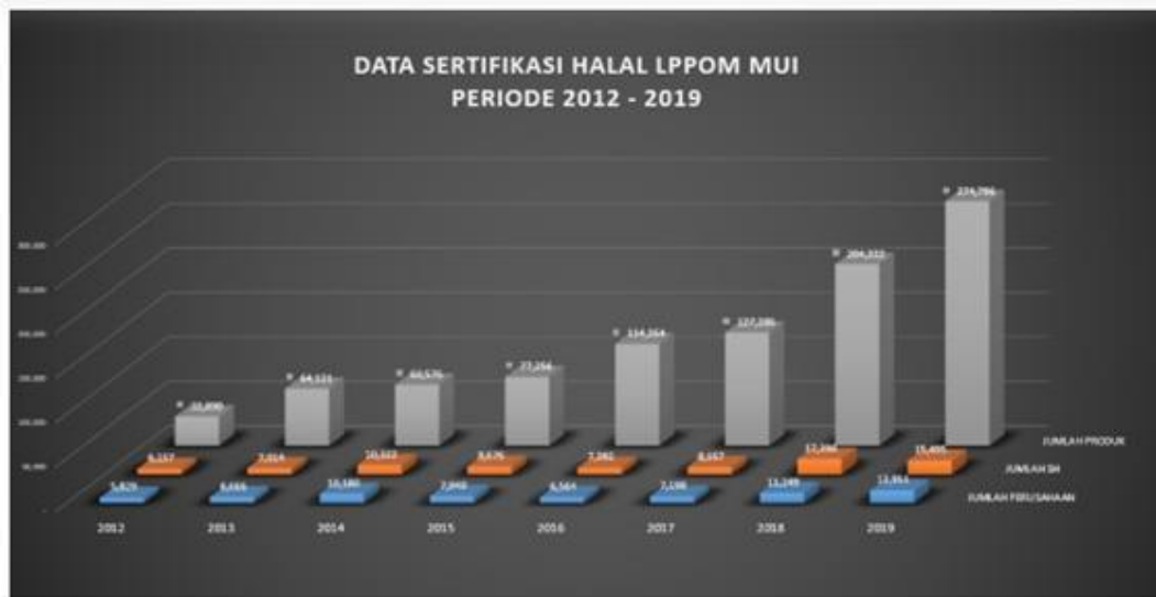
Gambar 1. Data Sertifikasi Halal LPPOM MUI Periode 2012-2019