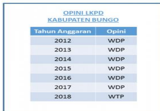
Tabel 1. Opini Kabupaten Muara Bungo dari BPK Atas LHP LKPD Tahun 2012-2018

Sumber: BPK Perwakilan Prov.Jambi (2019)